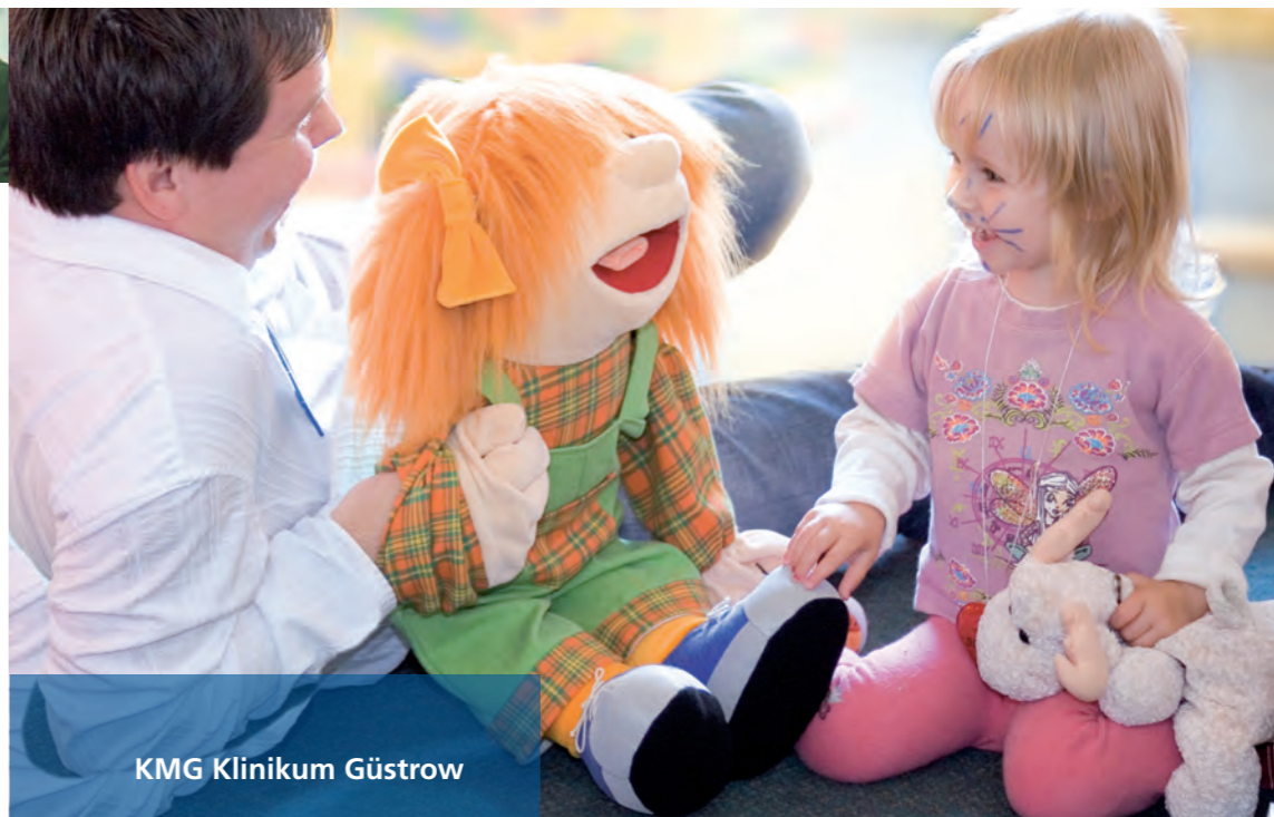
KMG Klinikum Güstrow